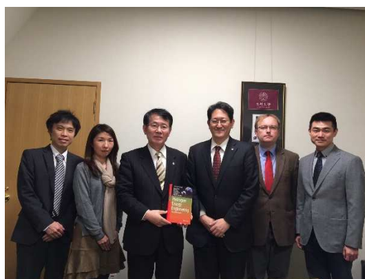
久保総長と執筆者（代表）で 記念撮影！